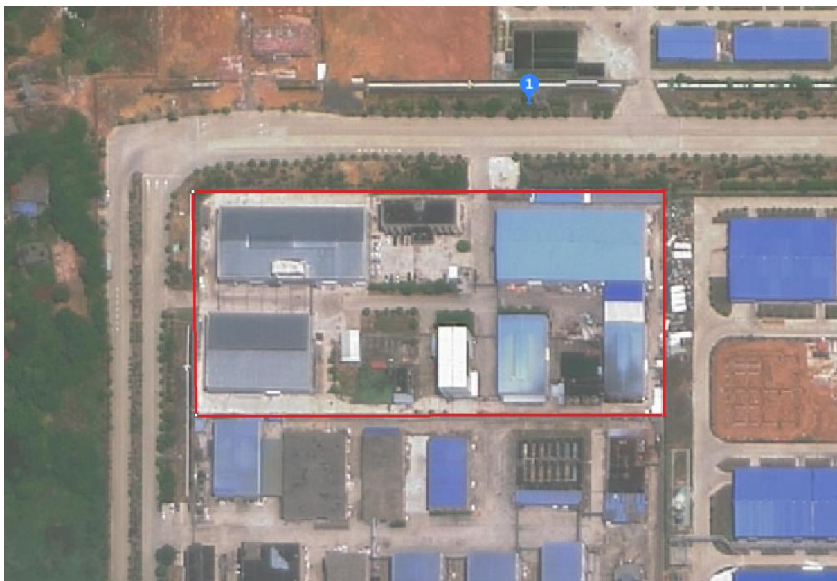
表 2.3-2 该公司周边环境分布情况表